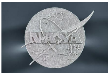
使用新合金材料进行 3D 打印的 NASA 图标

美国国家航空航天局（NASA）和俄亥俄州立大学合作利用 3D 打印工艺将金属合金与陶瓷颗粒结合，制造出迄今为止最耐用的高温合金，可显著提高飞行器部件的强度和韧性 16 。